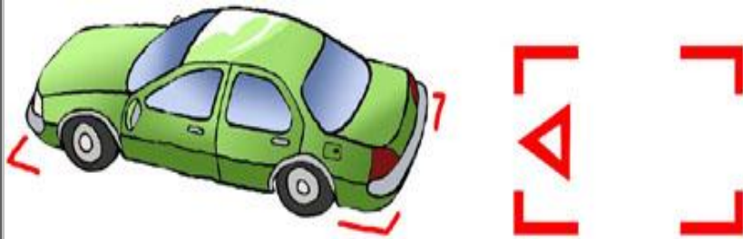
第一種 車角定位法